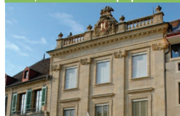
Hôtel de Ville, Orbe (VD)