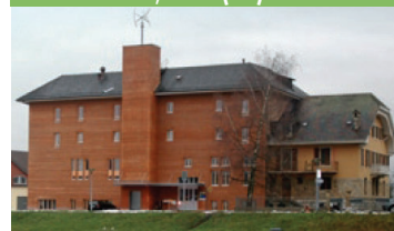
Bâtiment administratif, Yverdon (VD)